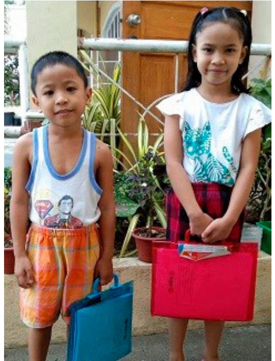
To av barna klare til å gå på skolen igjen.

No startar me om att med sponing av grunnskulegang for barn i desse fattige samfunna, og det er ein krevjande prosess. Det er berre å håpa at mange av dei, som me har sponsa før, vil halda fram med sin skulegang. Det er nok ein del som ikkje gjer det.