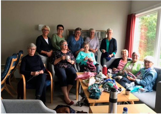
Damene i strikkeklubben samlet til en aktivitetsekveld.