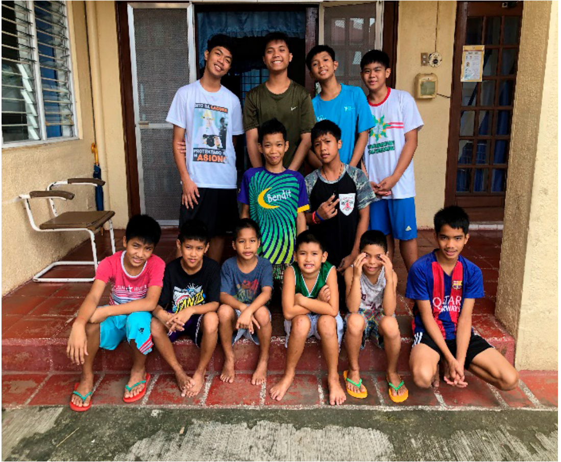
Heile guteflokken samla på trappa, ein god gjeng.

Aldrin har opplevd å vera mykje åleine under pandemien og også i den siste tida. Enno er ikkje all undervisning blitt «face to face» - mykje skjer framleis digitalt.