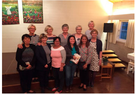
Besøk fra Filippinene er alltid hyggelig