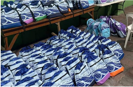
Nye skulesekkar klare til utdeling.