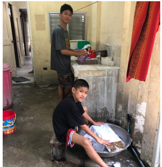
Gutane lærer tidleg å vaske klede sine. Der er kunnskap som er viktig å ta med seg i livet.