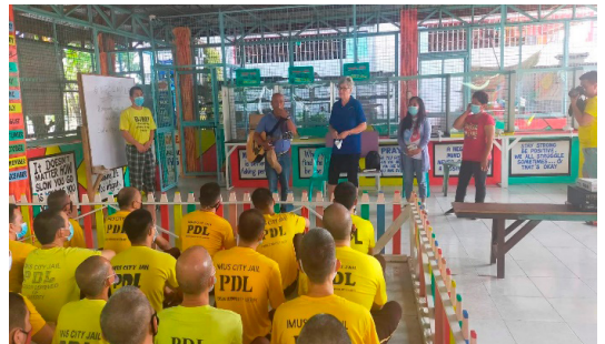
Endelig er vi tilbake og kan møte fangene ansikt til ansikt igjen.