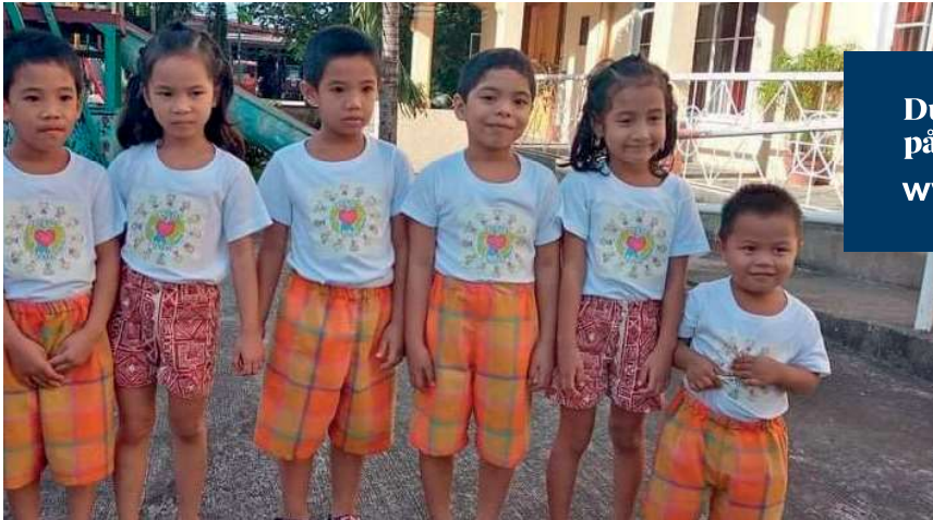
Småguttene i sine nye «gardinbukser».

Du finner også nyhetsbrevet på hjemmesiden vår: www.mamachildren.org